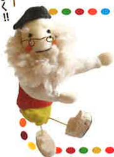
健康長寿センターキャラクター wlc(ウルク)さん