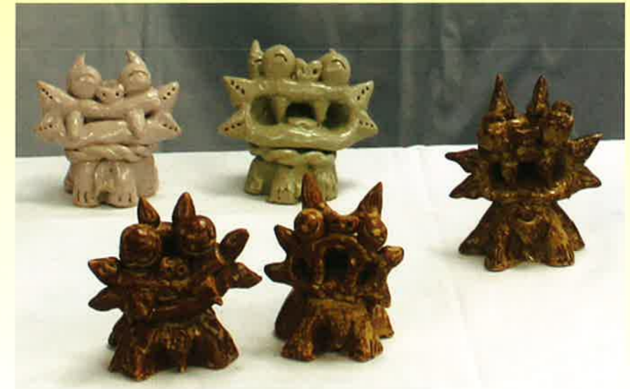
(内原野陶芸館[安芸市]にて/平成28年4月22日 「春の遠足」で製作)