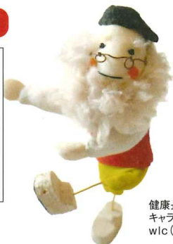
健康長寿センターキャラクター WLC(ウルク)さん